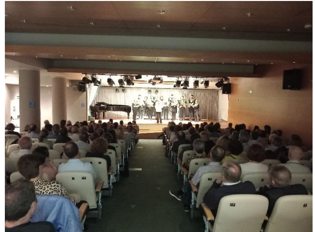
Concierto- Recital Benéfico (La mujer en femenino plural). 29 de noviembre de 2023