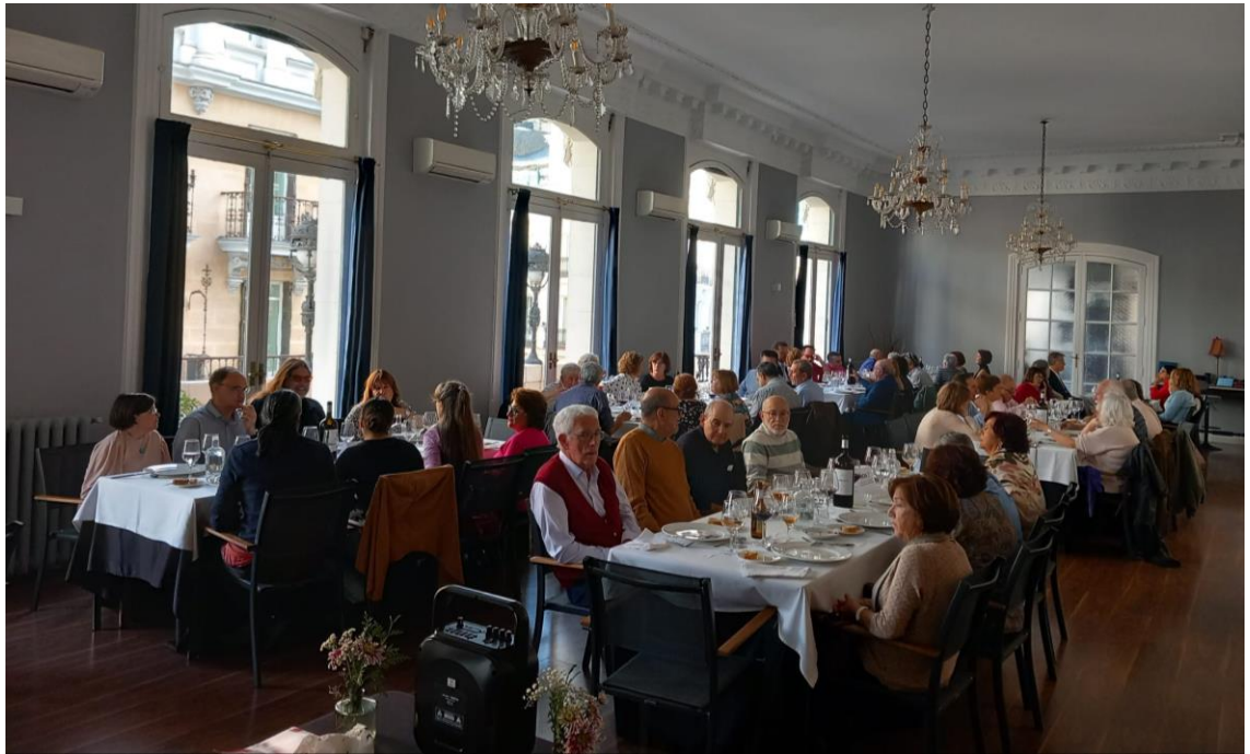
Senderismo Casa de Campo. 24 de marzo de 2023

Jornada de Convivencia 33ª Edición. 18 de noviembre de 2023