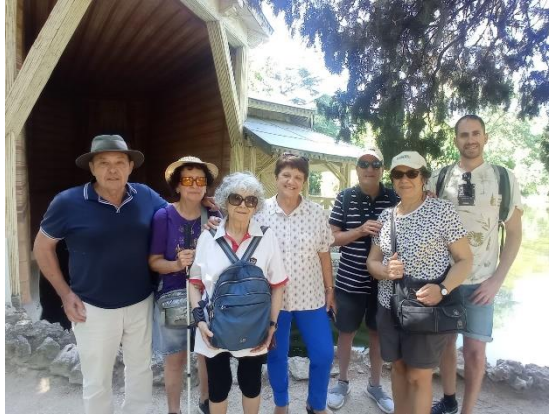
Excursión a Priego. 28 de octubre de 2023