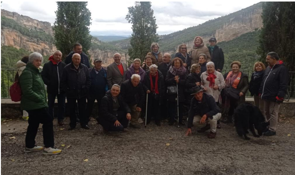
Ruta Literaria 1. 22 de mayo de 2023