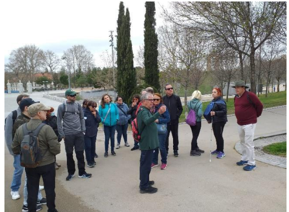
Senderismo Parque el Capricho. 7 de mayo de 2023