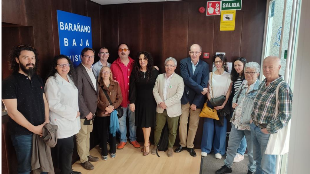
Visita Museo Naval 1. 7 de noviembre de 2023