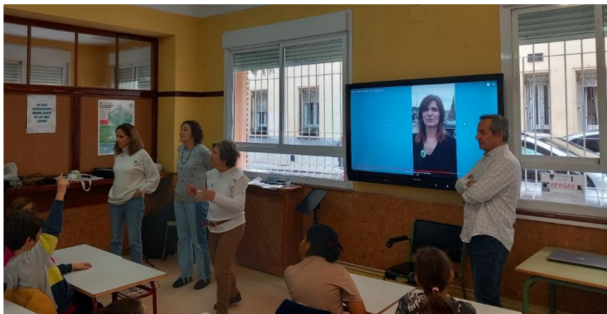
Visita Centro especializado en Baja Visión. 12 de abril de 2023