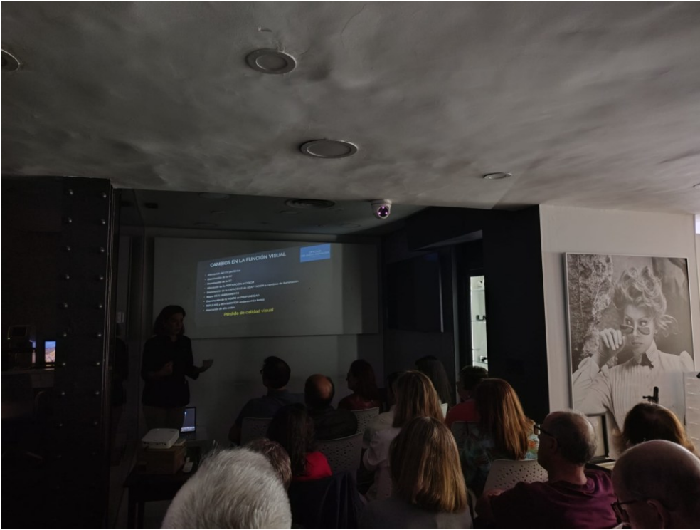
Charla Óptica Delgado Espinosa 07/05/2024