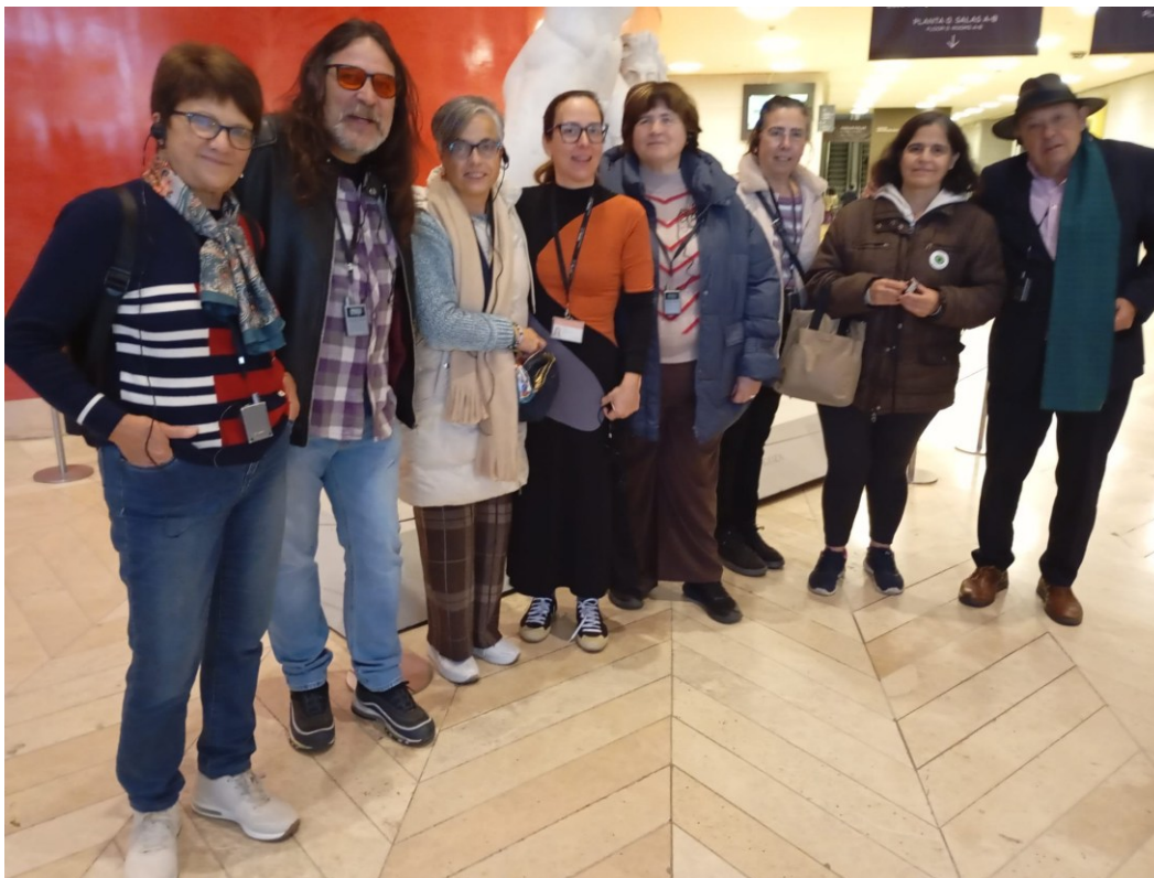
Museo del Prado "La poética del gesto" 13/12/2024