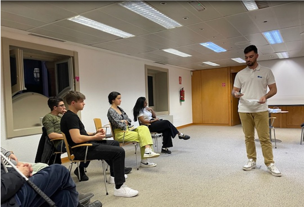
Lupa inteligente 25/01/2024