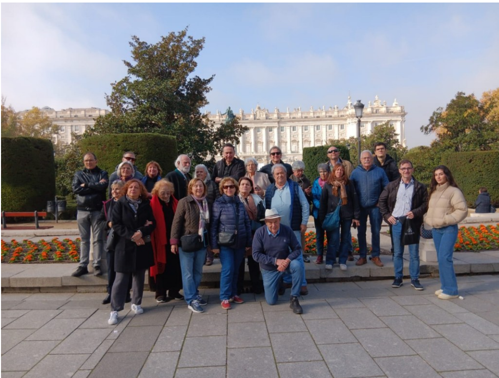
Ruta musical “ENTRE AUSTRIAS Y BORBONES” 19/11/2024